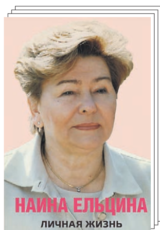
НАИНА ЕЛЬЦИНА ЛИЧНАЯ ЖИЗНЬ

Важнейшее событие для издателей всего мира — 69-я Франкфуртская книжная выставка-ярмарка — в нынешнем году пройдет 11–15 октября. Специально для «Д» организаторы российского павильона отобрали десять лучших российских книг, которые будут там представлены.