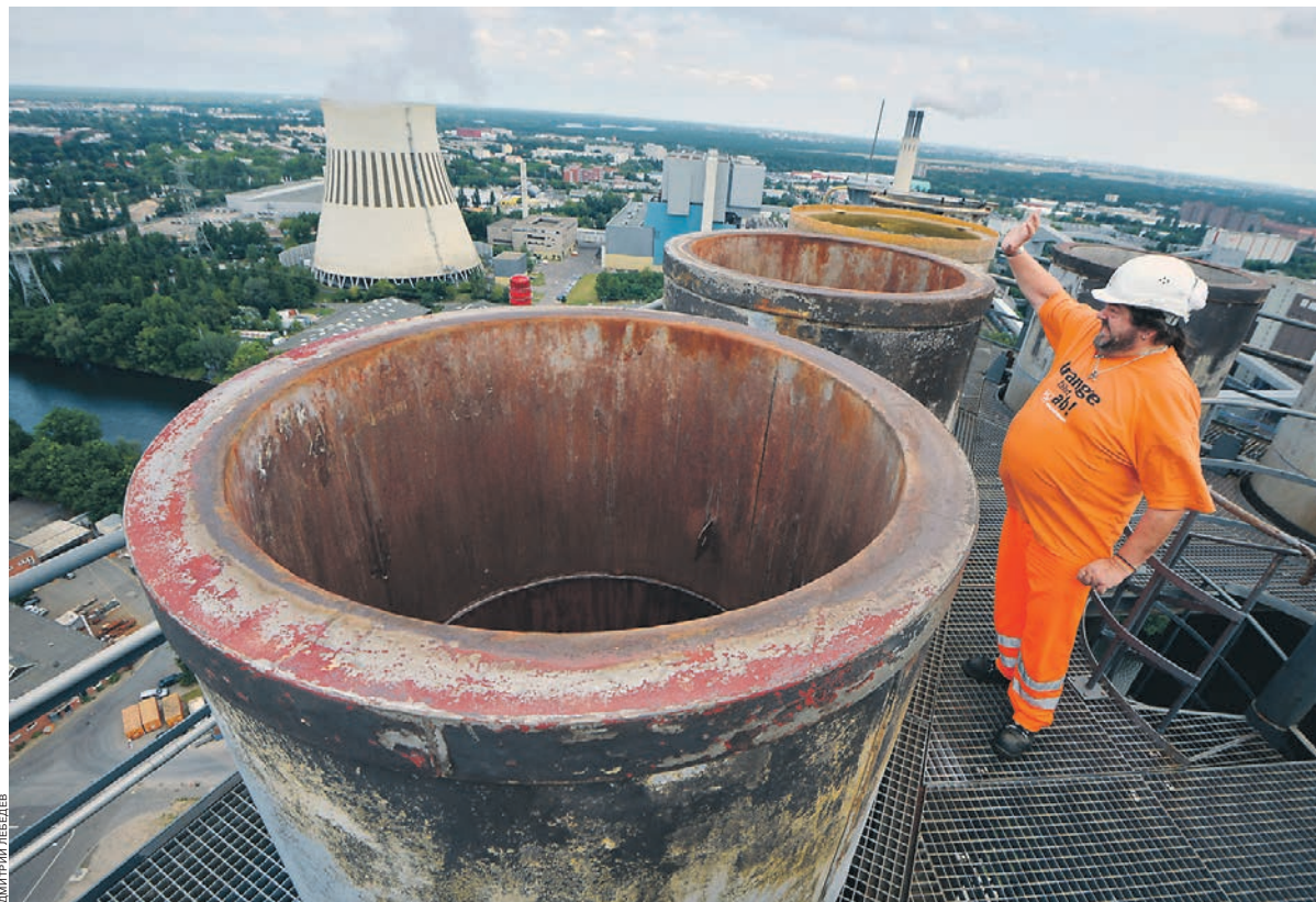
В Германии переработка мусора производится на высокотехнологичных предприятиях

— Согласно. В свое время такое ноу-хау, как мусоропровод в многоквартирных домах, настолько избаловало советского, а впоследствии российского гражданина, что сегодня, по-