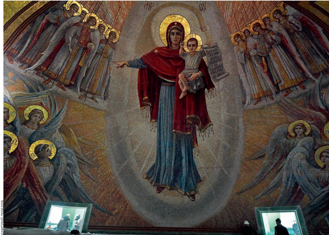
— «Мозаика Богородицы в верхнем храме»

Добраться до главного храма вооруженных сил в Кубинке непросто. Сначала надо поймать электричку до Голицыно, которая ходит раз в час. Потом найти на площади старого подмосковного поселка место, откуда отходит бесплатный автобус. Его пустили недавно, и точку знают далеко не все. «Парк „Патриот“», — кивает сотрудница правоохранительных органов в новой форме и указывает направление. На месте уже стоит автобус «Мособлтранс» с открытыми дверями. Я пытаюсь провести по турникету карточкой, турникет молчит. «Бесплатный проезд», — устало говорит мужчина в зеленой форме без погон. Через двадцать минут дороги по Минскому шоссе и десять минут петляния по просторам парка «Патриот» автобус подвозит меня к остановке «Храм вооруженных сил». Этот новый храм называют «имперским» и «византийским», то и другое определения верны не совсем.