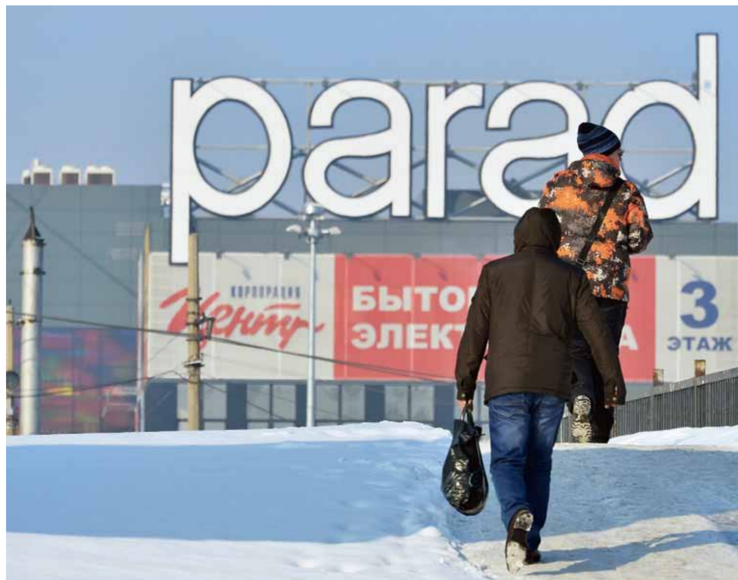
Бум строительства торговых центров в Алтайском крае не решил проблемы обеспеченности региона качественными торговыми площадями, большая часть из них сконцентрирована в столице края — Барнауле.