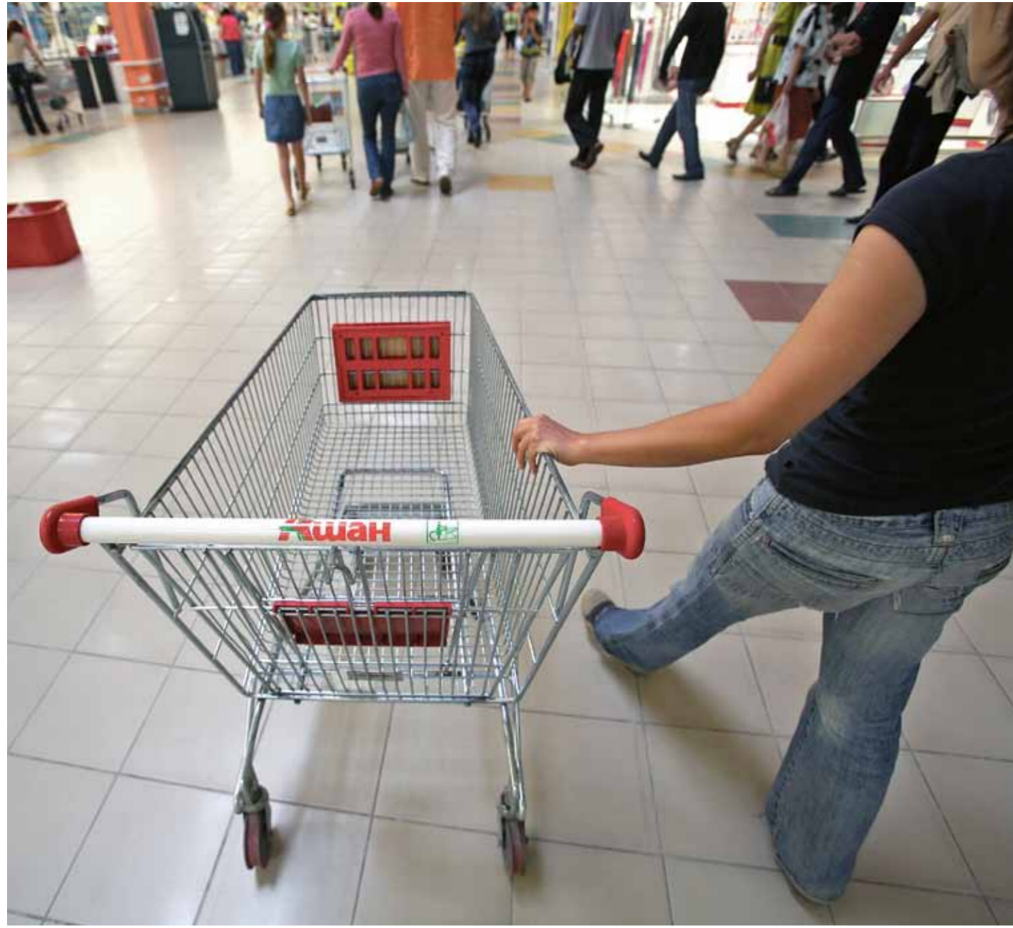
Несмотря на бурное развитие ритейла в Сибири, рынок, по оценкам экспертов, до сих пор остается сравнительно ненасыщенным и конкуренция на нем формируется пока на относительно комфортном уровне.

В 2012 году торговые центры в Сибири открывали в основном федеральные ри-