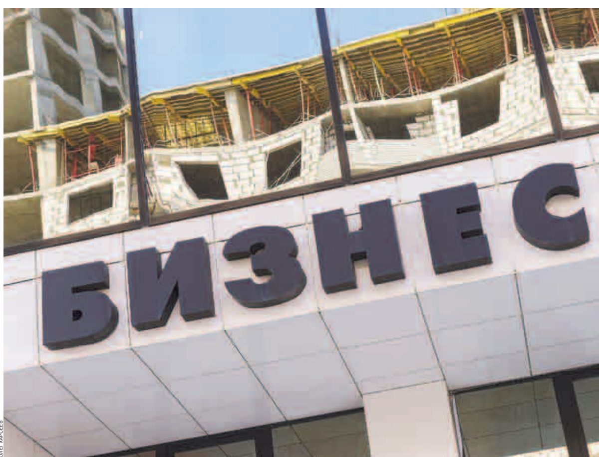
Любой новый проект несет определенный риск, а к такому риску сейчас у бизнеса аппетит гораздо ниже, чем несколько лет назад