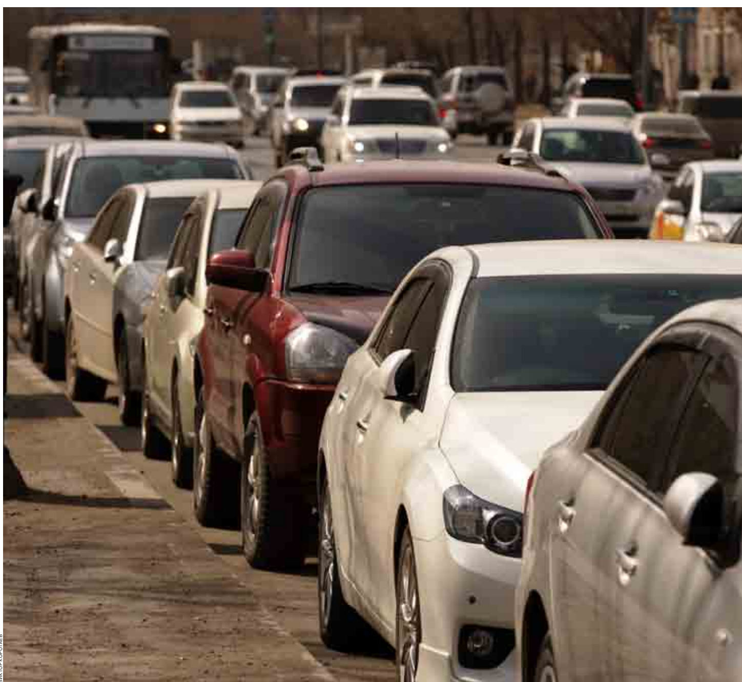
Предполагается, что в результате реформы стоимость полиса ОСАГО будет зависеть не от технического состояния автомобиля, а от возраста и стажа водителя