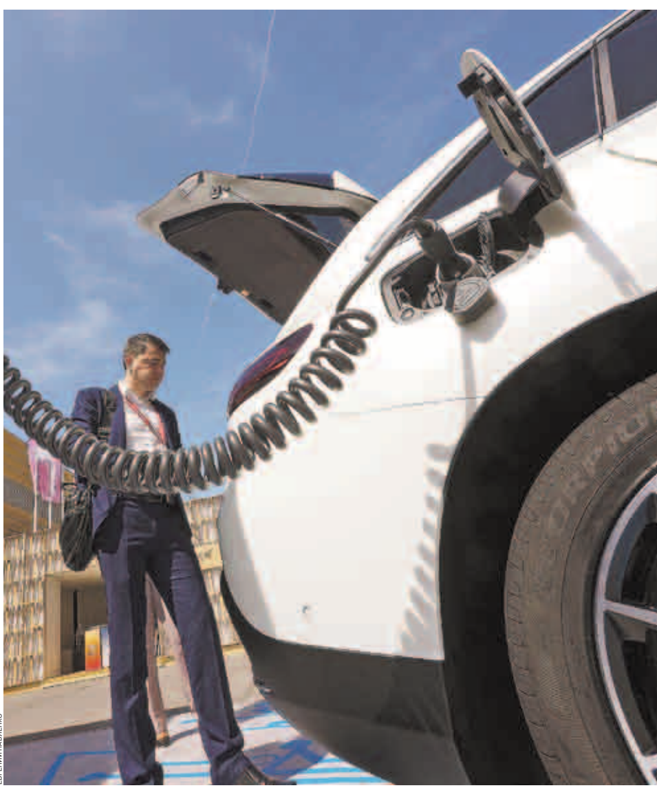
Сибирь является лидером по количеству сделок по продаже б/у электрических автомобилей

Стоимость Nissan Leaf 2020 года выпуска под заказ в Новосибирске обойдется в 3,5 млн руб. Подержанная модель Nissan