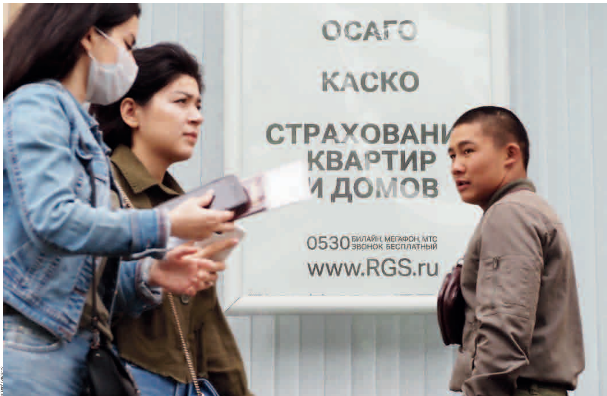
Выплаты по всем видам страхования в Сибири в первой половине 2020 года выросли на 36%

Положительная динамика в сегменте страхования от несчастных случаев и болезней наблюдалась практически во всех регионах Сибири, кроме Тувы и Республики Алтай. В Кемеровской, Иркутской, Томской областях, Республике Хакасия рост был более чем двукратный.