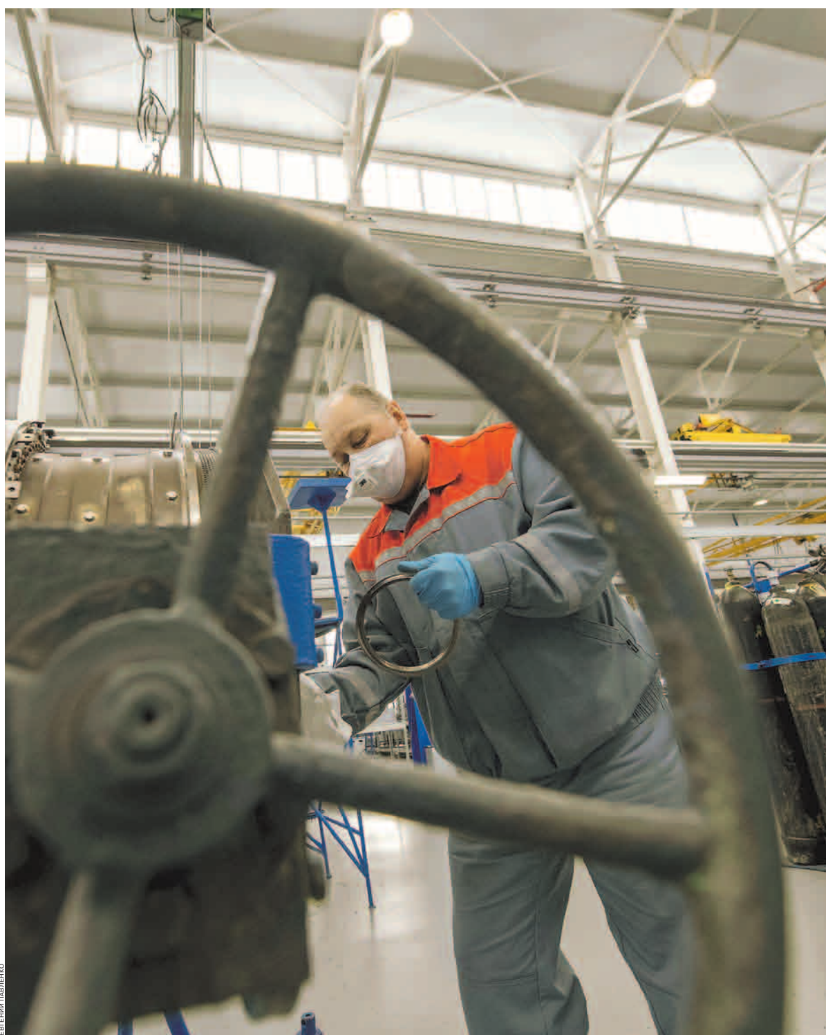
Наибольший спад в отрасли производства в Сибиря показал сырьевой сектор, в том числе добыча полезных ископаемых