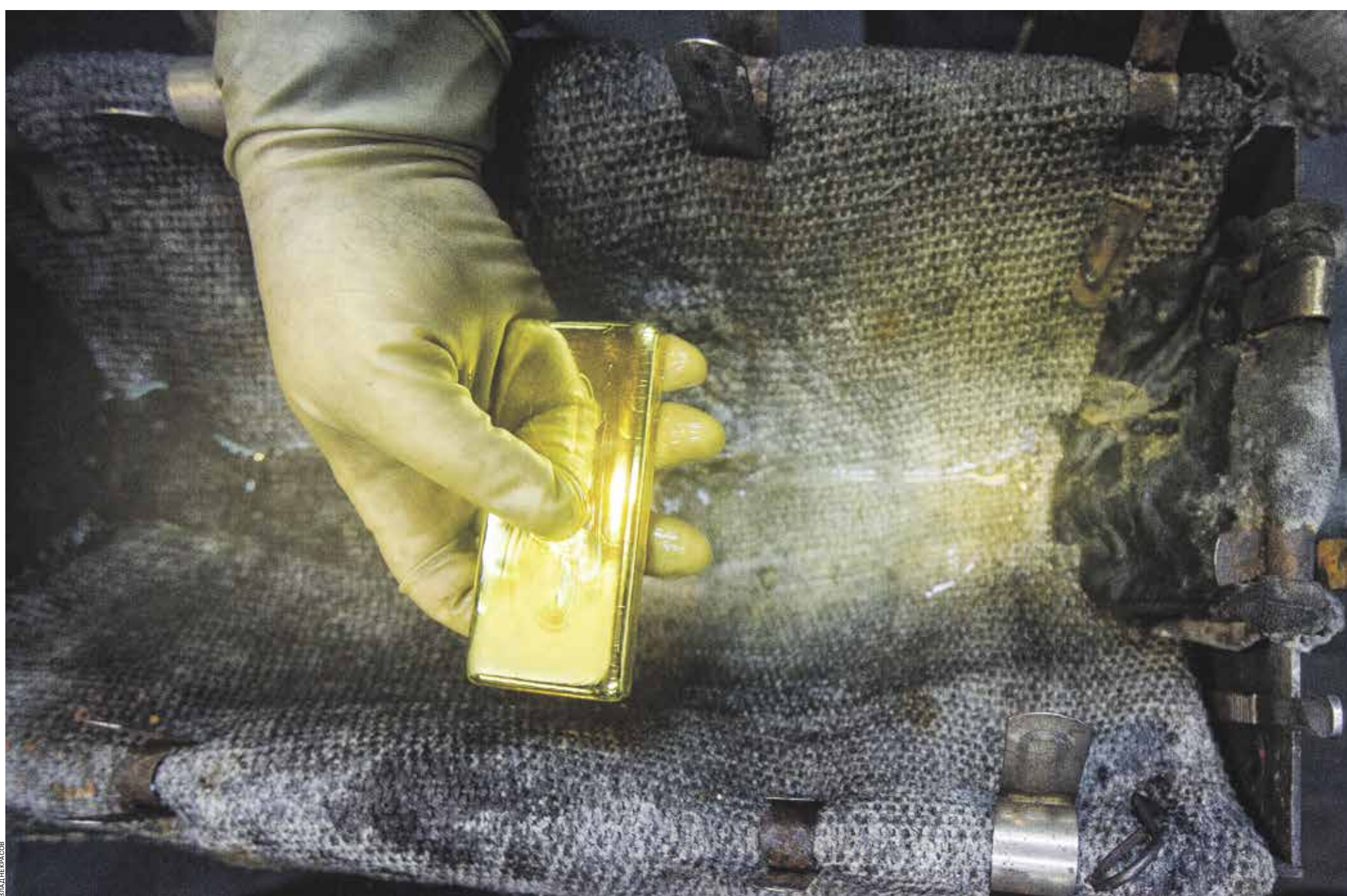
Снижение добычи в Сибири эксперты связывают с сокращением содержания золота в переработанной руде

В прошлом году с января по ноябрь регионами России было добыто 277 т золота, что на 2% больше, чем годом ранее, сообщает Минфин РФ. Положительная динамика в большей степени обусловлена ростом добычи предприятиями Дальневосточного федерального округа, которые увеличили свои показатели на 13%, до 175 т. Это данные с учетом добычи золота в Республике Бурятия и Забайкальском крае. В 2018 году, по решению президента России, эти два региона вышли из состава Сибирского федерального округа и присоединились к ДФО. В то же время в Сибирском федеральном округе объемы добычи золота сократились с января по ноябрь 2020-го на 18%, было добыто 83 т.