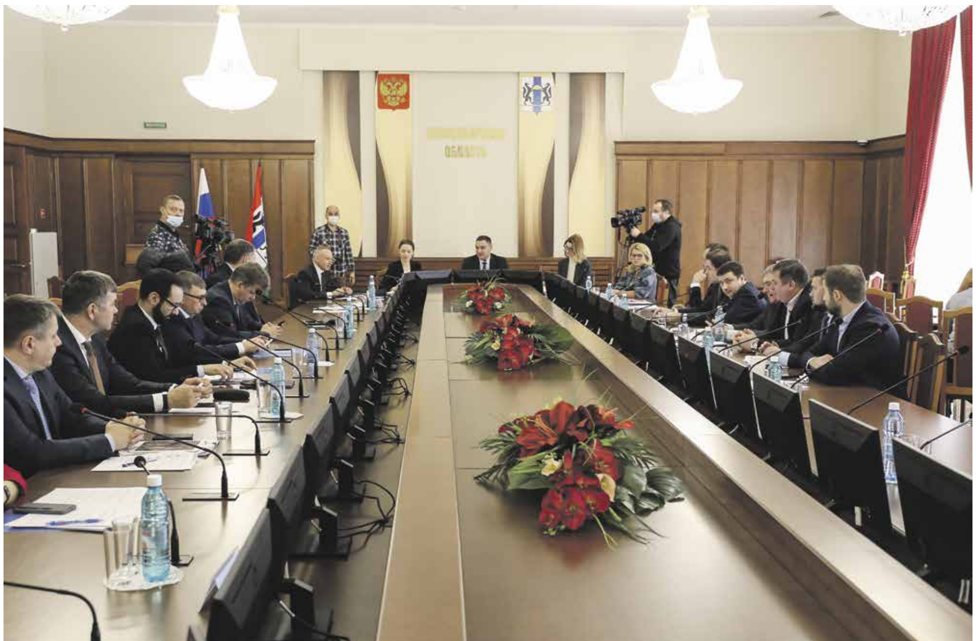
Поправки вызвали немало вопросов у депутатов, основные из них касались решения правительства уменьшить финансирование туристической навигации в регионе

По данным министерства, на сегодняшний день туристическая навигация внедрена в 13 районах области, однако в дальнейшем правительство не намерено реализовать этот проект из-за отсутствия в бюджете средств. «У нас там даже миллиона нет. В основном финансирование идет на обслуживание и их текущее содержание», — заявил глава ведомства. В то же время, отметил Лев Решетников, решить вопросы развития сферы туризма призван национальный проект, который сегодня разрабатывают федеральные власти. В Новосибирской области в свою очередь власти готовят отдельную государственную программу по туризму. «В ней будут представлены не только план развития этой сферы, но и вопросы инфраструктуры, чтобы мы могли реализовать и завершить те проекты, о которых уже было сказано, в том числе построить дорогу в Искитимском районе. Деньги это небольшие — около 1–2 млн руб. Но мы сможем о ней говорить только после того, как