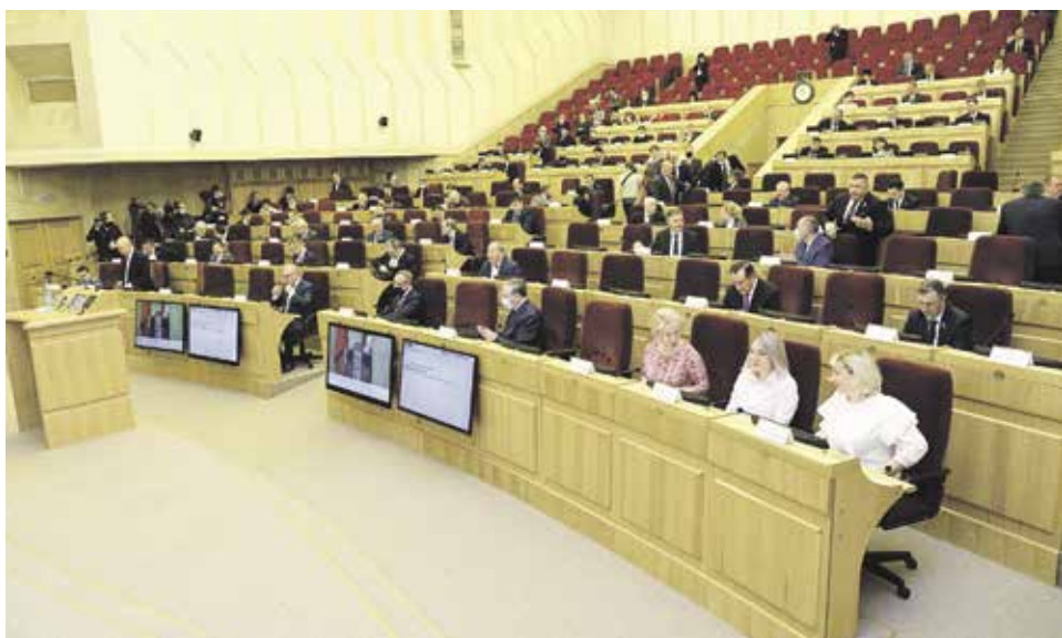
Региональные депутаты обратились к мэрии Новосибирска с требованием скорейшего наведения чистоты и порядка в городе