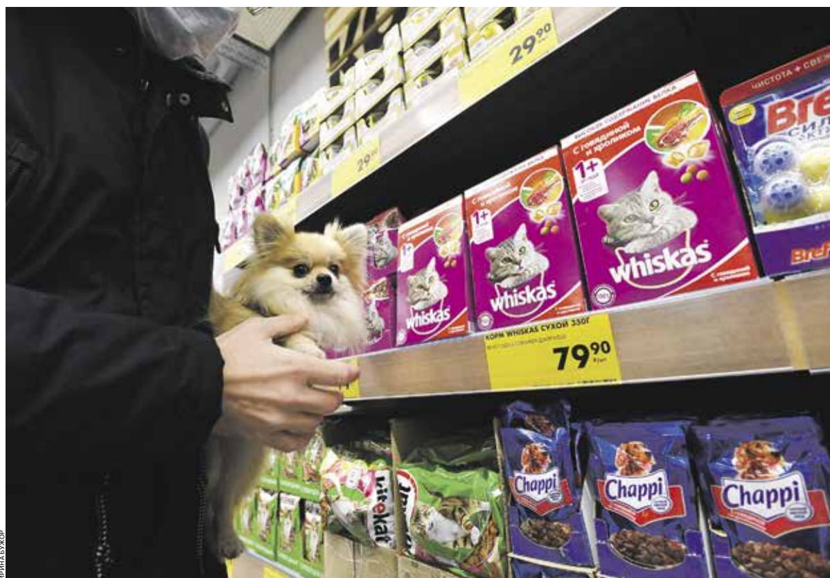
Рынок для производителей товаров для домашних животных из года в год демонстрирует стабильный рост вне зависимости от экономической ситуации в стране

При этом все больше заводчиков выбирают полнорационные корма промышленного производства: их используют 52% владельцев собак (45% в 2017 году) и более 80%