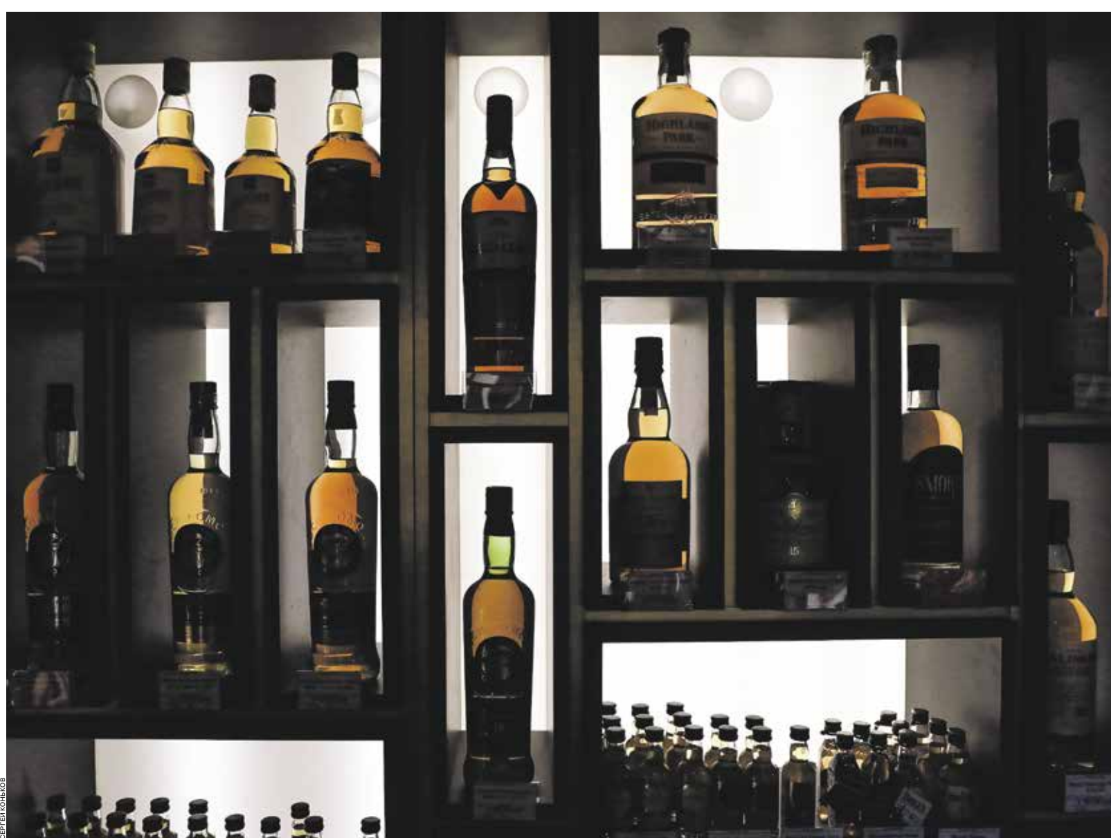
Производители алкогольных напитков отмечают рост конкуренции за место на полке, за то, как представлен бренд и каким ассортиментом

В условиях заметного падения покупательной способности многие