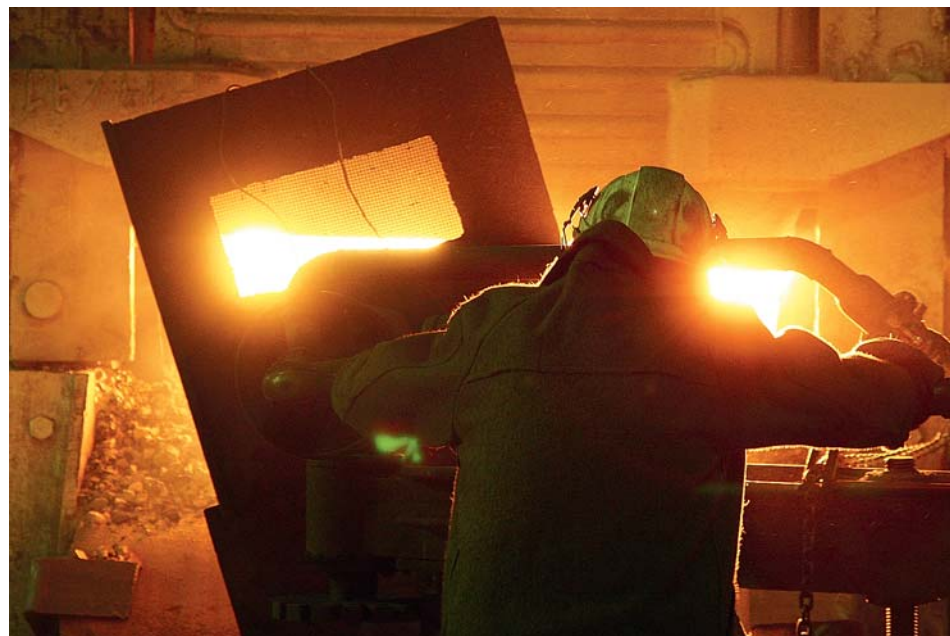
По мнению аналитиков, потенциал есть у бумаг «Мотовилихи» за счет возможности вхождения в крупный машиностроительный холдинг, а также у акций ТГК-9, которые сейчас недооценены