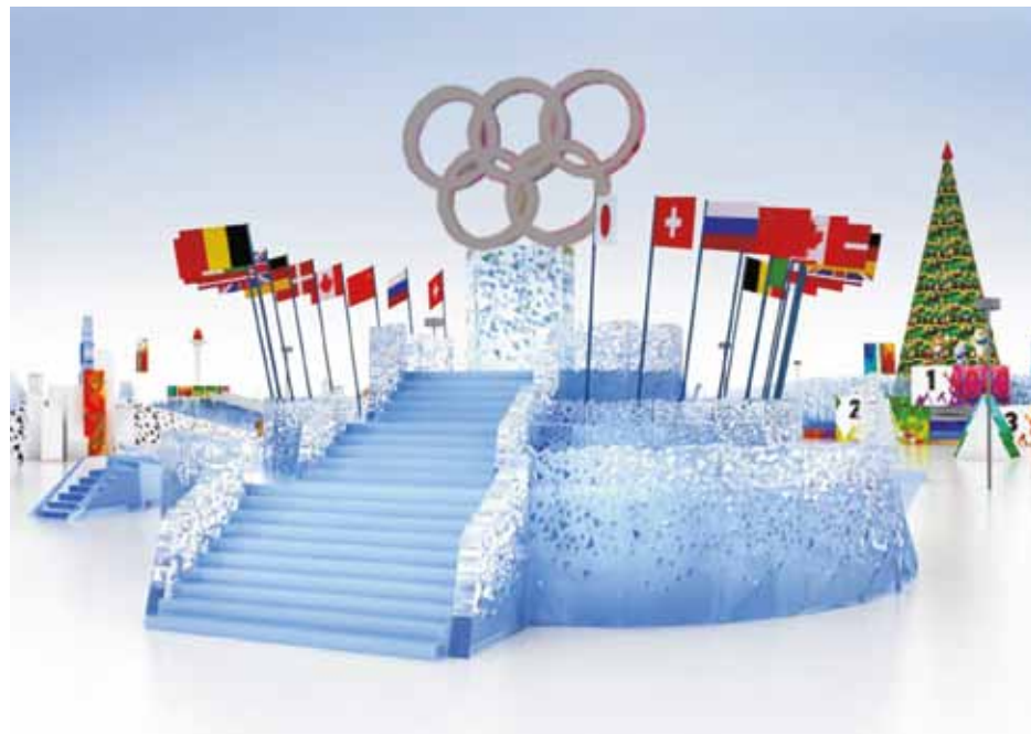
В ЭТОМ ГОДУ ГЛАВНАЯ ТЕМАТИКА ПРАЗДНИКА — ЗИМНЯЯ ОЛИМПИАДА В СОЧИ

В отличие от Перми в Екатеринбургe организована еще одна крупная новогодняя площадка — «ГлавЕлка». Это полностью коммерческий проект на площадях выставочного комплекса