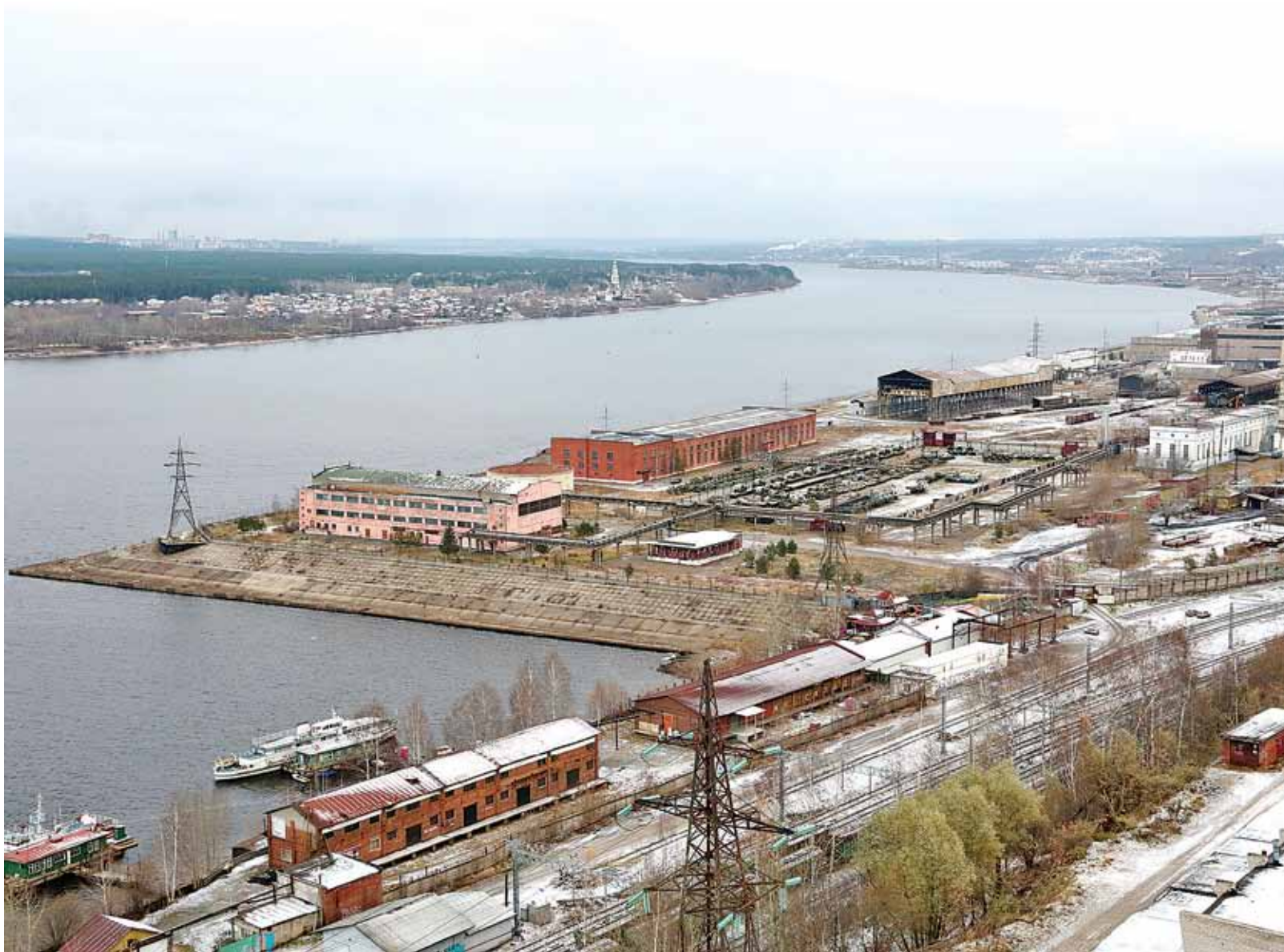
«Мотовилихинские заводы» планируют организовать на части своих площадей, не занятых в основном производстве, индустриальный парк

Всего «Сода-Хлорат» владеет 92 га земли, из них используется лишь 8–10 га. По замыслу руководства «Соды», есть желание на этих площадях организовать химический кластер. «Есть несколько заявок от желающих стать резидентами парка», —