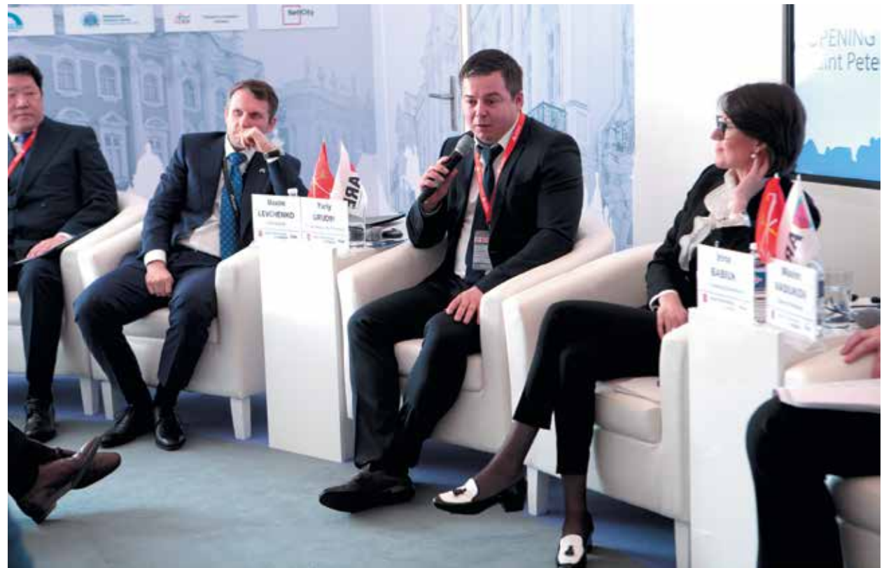
Петербург на выставке MIPIM презентовал более 30 перспективных инвестиционных проектов на $3 млрд, в том числе в сфере инноваций, комплексного освоения территорий, здравоохранения, транспортной, конгрессно-выставочной и гостиничной инфраструктуры

Холдинг «Эталон» заключил со Смольным соглашение о создании социальной инфраструктуры в рамках проекта «Галактика» по схеме ГЧП. А власти города рассчитывают на помощь девелопера в реализации совместного инвестпроекта с Белоруссией. По предварительным договоренностям, «Эталон» получит