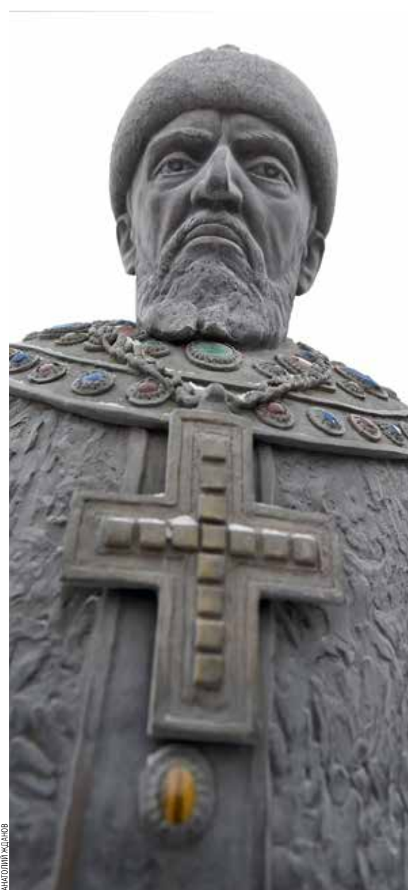
ВО ВРЕМЕНА ИВАНА ГРОЗНОГО БЛАГОТВОРИТЕЛЬНОСТЬЮ СЧИТАЛАСЯ РАЗДАЧА ДЕНЕГ НИЩИМ, ВДОВАМ И СИРОТАМ. С ТЕХ ПОР ПРЕДСТАВЛЕНИЯ О ПОМОЩИ НУЖДАЮЩИМСЯ НЕ ПРЕТЕРПЕЛИ СЛИШКОМ БОЛЬШИХ ИЗМЕНЕНИЙ

Тем не менее КСО в России продолжает развиваться. Так, по данным международного исследования компании Regus, корпоративная социальная ответственность имеет важное значение для офисных сотрудников: 49% россиян считают важным данный вид деятельности в своей компании, а во всем мире так думает 41% опрошенных.