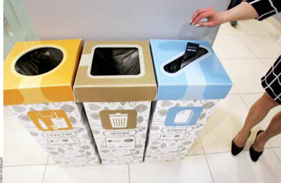
ОДНОЙ ИЗ ГЛАВНЫХ ОБЩЕЧЕЛОВЕЧЕСКИХ ЦЕННОСТЕЙ ПРОГРАММ КСО ЯВЛЯЕТСЯ ЭКОЛОГИЧНОСТЬ БИЗНЕСА

Одной из главных общечеловеческих ценностей и трендов программ КСО является экологичность бизнеса. Тема воздействия на окружающую среду давно вышла за пределы дискуссий экологов. Теперь экологическая стратегия — не просто акт доброй воли самих производителей, это запрос мирового сообщества: потребителей, сотрудников, власти. «Чтобы ему соответствовать, ведущие компании мира взяли на вооружение стратегию Zero Waste, которая имеет два направления: „ноль отходов“ и „ноль потерь“. В первом речь идет о раздельном сборе и переработке отходов. Например, в Coca-Cola стоит цель к 2030 году собирать 100% эквивалента выпускаемой упаковки и направлять ее на переработку. Вторая цель — „ноль потерь“ — формирует запрос на развитие более совершенных ресурсосберегающих технологий, снижение потребления воды и энергии на единицу продукции и возобновляемые источники энергии. Например, использование внешнего холода