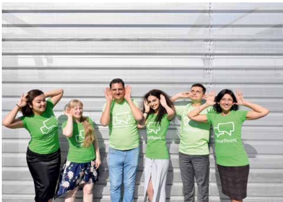
ПОРТАЛ WWW.YOUBEAR.RU БЫЛ СОЗДАН В СООТВЕТСТВИИ С МЕЖДУНАРОДНЫМИ СТАНДАРТАМИ ПРОЕКТА HEAR PEERS

«Ты слышишь» — так переводится название проекта, представленного на одноименном интернет-портале. «Ты слышишь» — без преувеличения, магическая формула счастья для человека со слуховым аппаратом или имплантатом. Ресурс www.YouHear.ru помогает воплотить магию в реальной жизни пациентов. Начинаясь проект, как это нередко бывает, с мало-