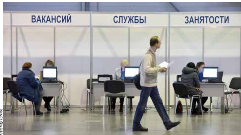
В ПЕТЕРБУРГЕ ОРГАНИЗАЦИЯМИ ВЫДЕЛЕНО 21 797 РАБОЧИХ МЕСТ ДЛЯ ТРУДОУСТРОЙСТВА ИНВАЛИДОВ, ИЗ НИХ ЗАНЯТО 14 733, ЧТО СОСТАВИЛО 67,6% ОТ КВОТЫ. ДАННЫЙ ПОКАЗАТЕЛЬ САМЫЙ ВЫСОКИЙ В СТРАНЕ

В структуре Смольного отмечают, что даже на крупном предприятии не всегда есть возможность трудоустроить людей с ограниченными возможностями. В связи с этим в прошлом году были внесены поправки в региональное законодательство.