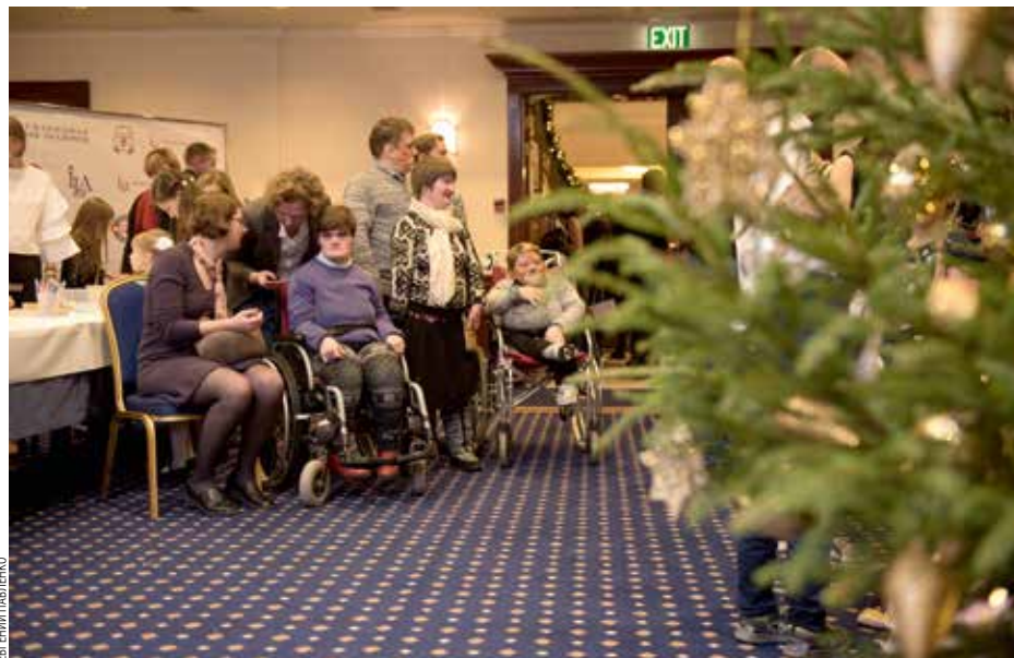
РАЗНИЦА ПОДХОДОВ К БЛАГОТВОРИТЕЛЬНОСТИ МЕЖДУ РОССИЙСКИМИ И ЗАРУБЕЖНЫМИ КОМПАНИЯМИ ОТЧАСТИ ОБЪЯСНЯЕТСЯ УРОВНЕМ РАЗВИТИЯ КОРПОРАТИВНОЙ СОЦИАЛЬНОЙ ОТВЕТСТВЕННОСТИ

НА ЧТО ТРАТЯТ? По материалам проекта «Лидеры корпоративной благотворительности — 2018», наиболее популярными направлениями являются образование (87% компаний-респондентов), социальная работа (85%), развитие местных сообществ (81%), экология (79%), здравоохранение и спорт (по 75%), культура и искусство (66%). В свою очередь, наименьший интерес у компаний вызывают такие направления, как развитие толерантности (9%), защита прав и свобод (11%), развитие правопорядка (15%). Что касается основных благополучателей корпоративной благотворительности, то их группы достаточно четко коррелируют с выделенными направлениями благо-