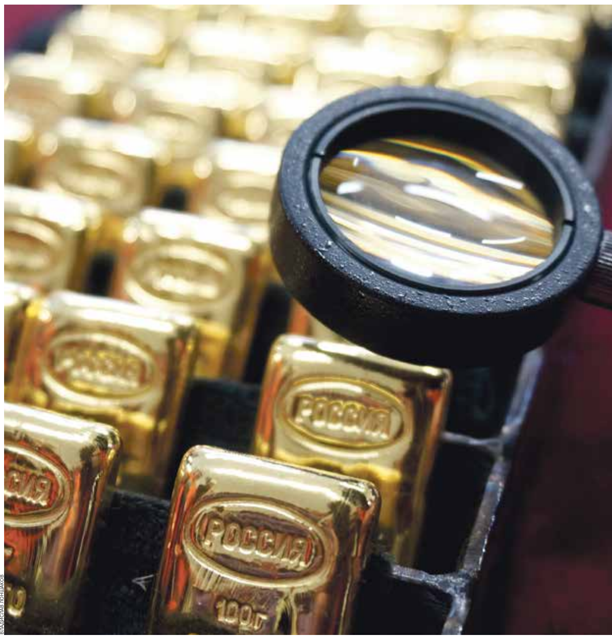
В случае с обезличенными металлическими счетами клиент не обладает реальным металлом — воспользовавшись услугой открытия ОМС, он привязывает вложенные деньги к курсу золота