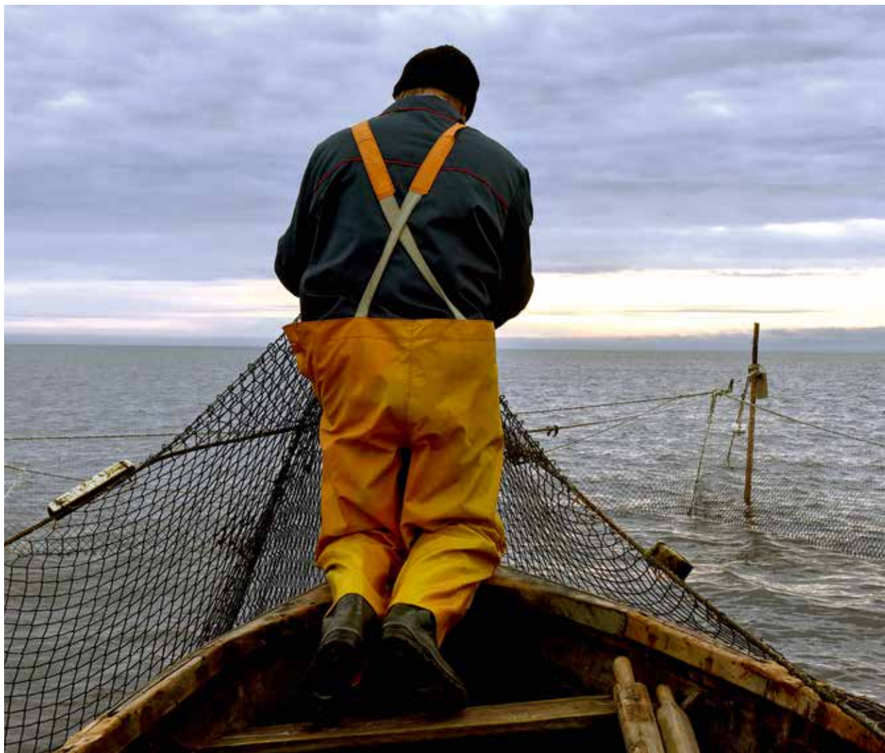
Совокупный ущерб государству от браконьерства достигает 20 млрд рублей в год