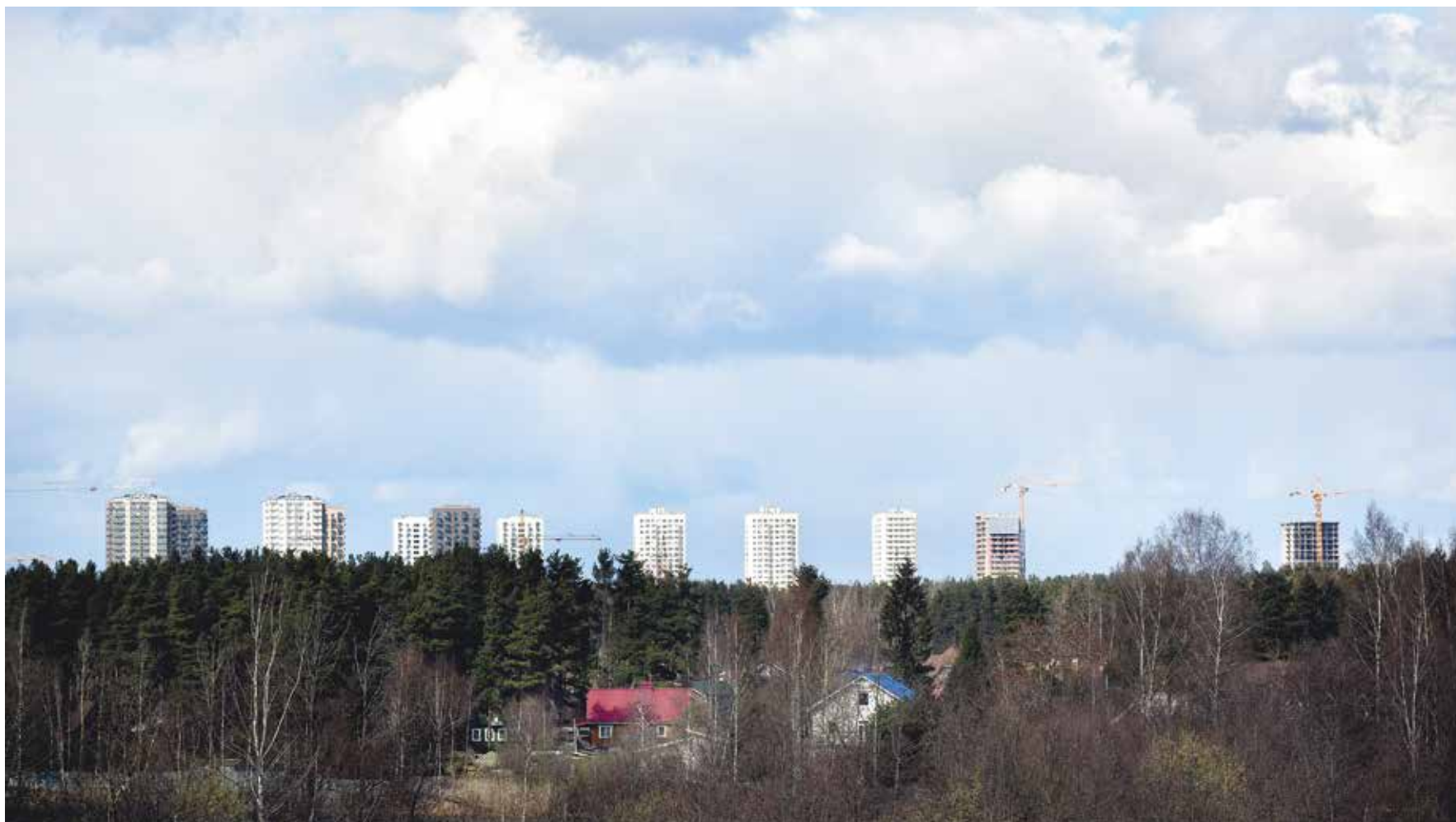
Приобретение социального жилья — одна из сопутствующих задач национального проекта «Жилье и городская среда»

ре); на участие в долевом строительстве жилого помещения (квартиры), расположенного на территории Санкт-Петербурга или Ленинградской области; на оплату цены договора уступки прав требований по договору участия в долевом строительстве жилого помещения; на оплату паевого взноса члена жилищно-строительного или жилищного кооператива; на оплату разницы между стоимостью приобретаемого по договору мены жилого помещения.