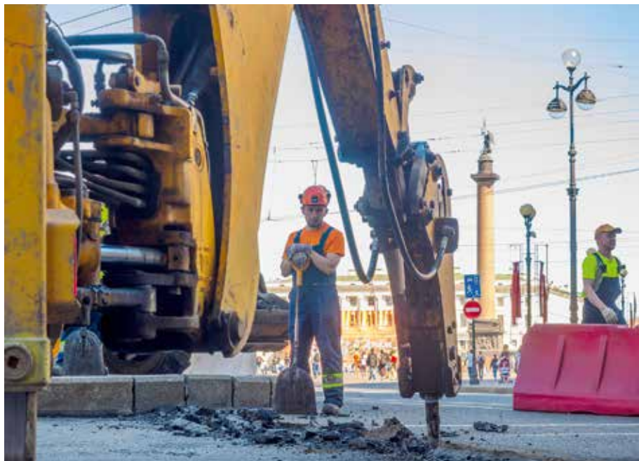
В дорожном фонде Петербурга на следующий год заложено 8 млрд рублей в рамках текущего ремонта трасс и 2 млрд рублей на капитальный ремонт Фото Евгения Павленко

Источник: комитет по развитию транспортной инфраструктуры