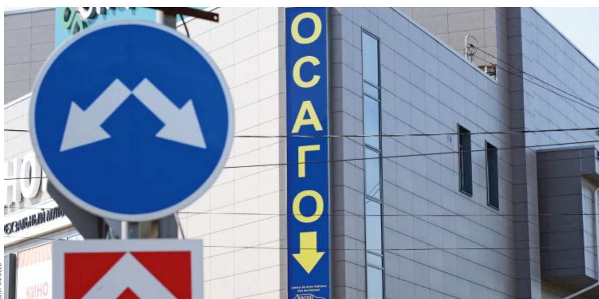
С начала года страховщики продали уже более 2 млн полисов e-ОСАГО