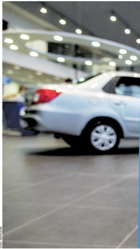
По итогам этого года рынок автокредитования в России может вырасти на 8–8,5%

По словам опрошенных «Банком» участников рынка, объемы кредитования продолжили расти и в третьем квартале 2017 года. Так, за первые девять месяцев Русфинанс банк выдал автокредитов почти на 49 млрд руб., это больше, чем за весь прошлый год. Розничный бизнес ВТБ в Самаре за девять месяцев 2017 года выдал 1,3 тыс. автокредитов на сумму 615 млн руб., что на 2,5% выше аналогичного показателя прошлого года. Самарская область, кстати, по данным НБКИ и «Автостата», входит в топ-10 субъектов РФ с наибольшими объемами рынка автокреди-