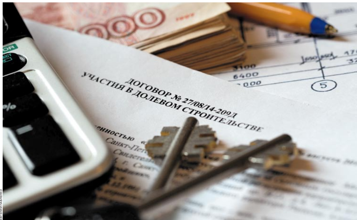
Застройщикам запретили совершать сделки напрямую с дольщиками с привлечением их средств

По мнению экспертов, покупатели и банки в основном выиграют от введенных изменений — они получают «понятных» застройщиков с прозрачной историей. «Заемщик получит более надежный и прозрачный продукт, что увеличит спрос на первичном рынке. Когда человек покупает у надежного застройщика квартиру, исключаются многие рис-