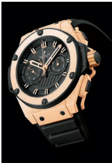
Hublot Big Bang Gold King Power

Мастер «Большого взрыва», автор фантастического Big Bang Жан-Клод Бивер успел поработать в главных часовых марках — Audemars-Piguet, Omega и наконец Blancpain, которую он воссоздал после долгой спячки. В 2004 году он возглавил Hublot. Уже через год он выступил с революционным концептом Big Bang. Последовал реальный взрыв на рынке: продажи подскочили в четыре раза. Конституционный диктатор Бивер находит время, чтобы разрабатывать каждый год новые варианты Big Bang, спонсировать разработки новых материалов, строить новую мануфактуру, бороться с контрафактом, делать сыр и вино на своей ферме и каждое утро с четырех до семи чатиться с клиентами на часовых сайтах.