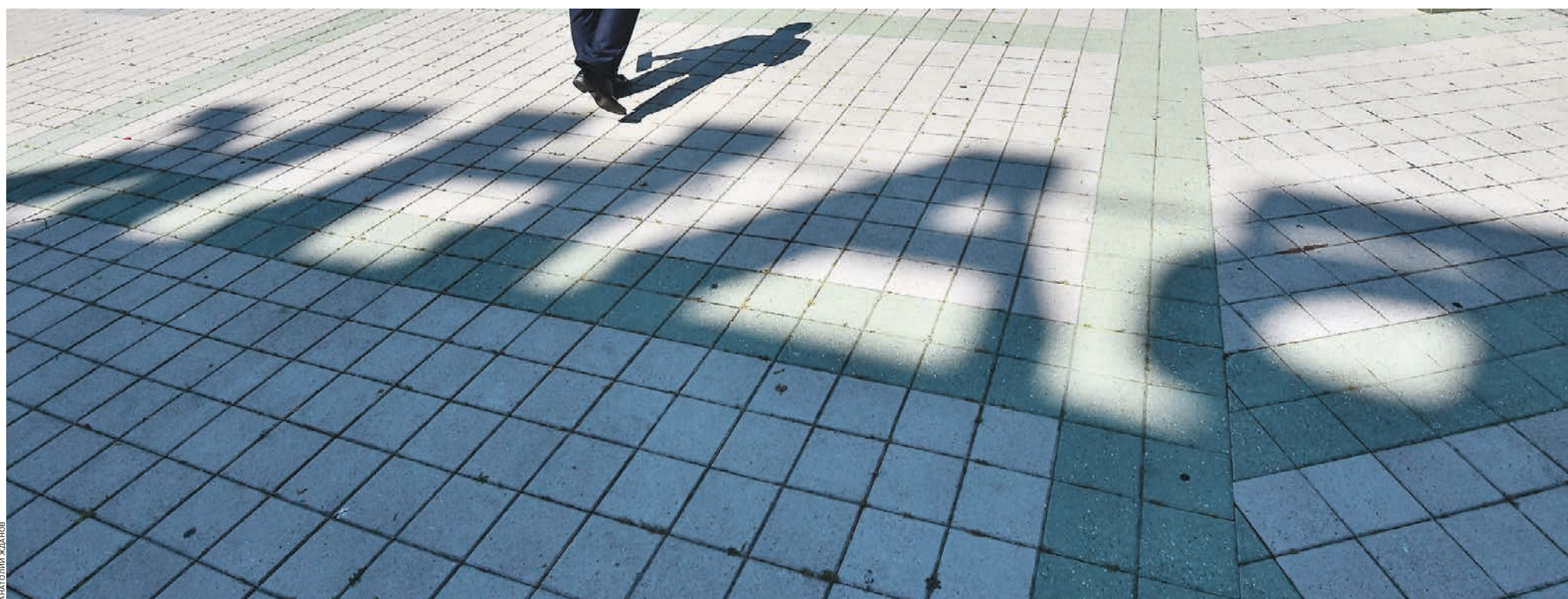
Режимность государства вывести из тени лизинговый бизнес участники рынка поддерживают, но ужесточения регулирования опасаются

Возможно, именно в силу отсутствия выигрышной переговорной позиции некоторые лизинговые компании не посчитали нужным предоставить развернутые комментарии для данной публикации „Ъ“, сославшись на различные обстоятельства. Кто-то не вполне согласен с реформой,