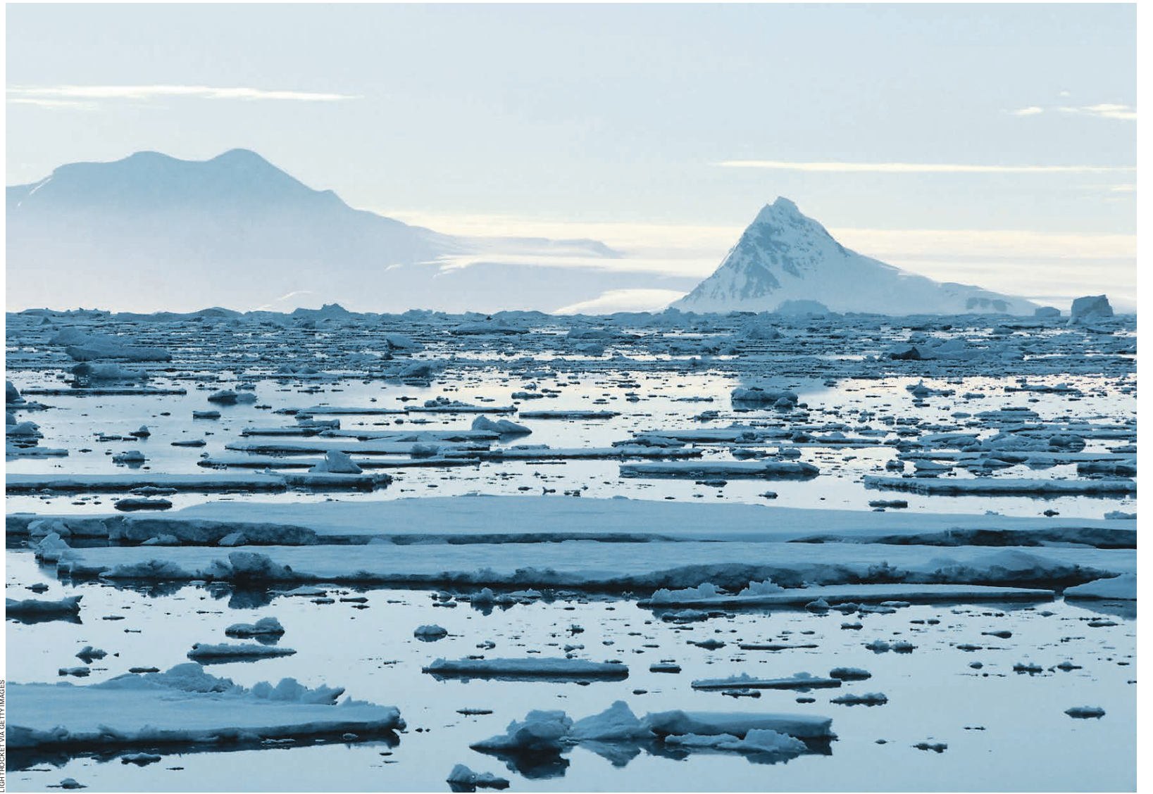
Чувствительная к изменению климата Арктика становится бомбой замедленного действия для всей планеты

Основным источником метана в атмосфере Арктического региона является шельф морей восточной Арктики — моря Лаптевых, Восточно-Сибирского моря и российской части Чукотского моря. Как отмечают ученые, по мере дальнейшего прогрева Арктики и освобождения арктических морей от поверхностного льда в летний период произойдет резкое разрушение слоя мерзлоты, в атмосферу одновременно будет выброшена большая масса метана, что, несомненно, отразится на климате не только Арктического региона, но и планеты в целом. Такой вариант получил название «метановая катастрофа».