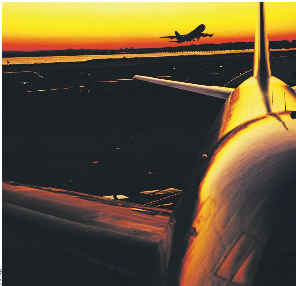
Единый рынок услуг в ЕАЭС должен найти отражение в реформе лизинга в России

В ЕЭК, в свою очередь, подчеркивают, что целью комиссии не является препятствование развитию национальных законодательств, она лишь контролирует выполнение обязательств, которые страны взяли на себя в рамках Договора о ЕАЭС в 2014 году. Директор департамента развития