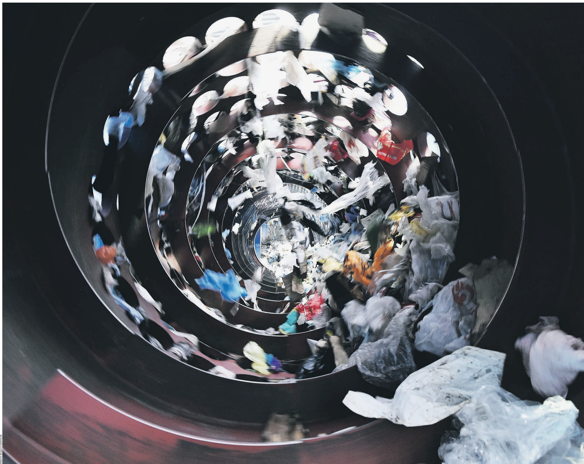
Концепция построения цивилизованной отрасли управления отходами в РФ уже более десяти лет ходит по кругу правок и согласований

В «дуальной» системе Германии такое отделение происходит на уровне