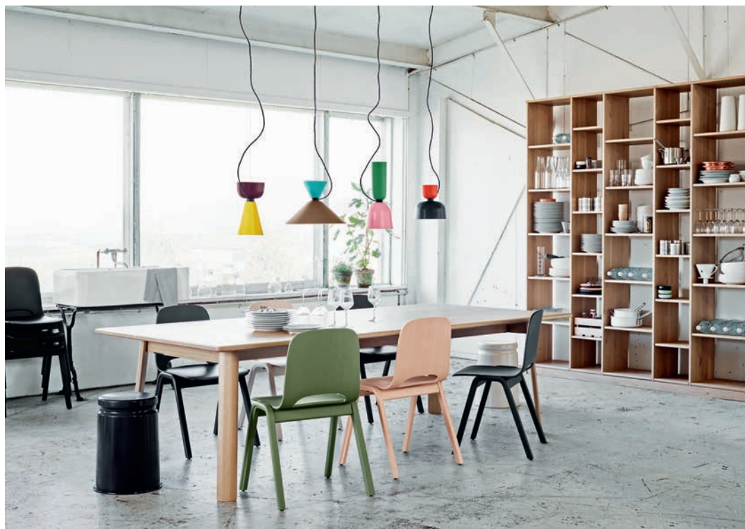
ЛАМПЫ АЛФАВЕТА ДЛЯ НЕМ