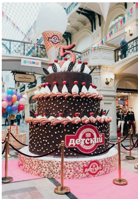
АРТЕМ ЕМЕЛЬНИЧЕНКО / ПРЕССТАФИЛД ИФО БОСКО

Семейный велнесс-клуб Pride в Жуковке запустил новую детскую программу: открыта развивающая секция «Школа активного мышления Ильина» (ШАМИ). Основная цель уроков в ШАМИ — всестороннее развитие личности ребенка и повышение общего интеллектуального уровня. Это достигается с помощью развития памяти и мышления, улучшения навыков скорочтения и грамотности. Занятия проводятся по субботам, подробную информацию можно получить в клубе.