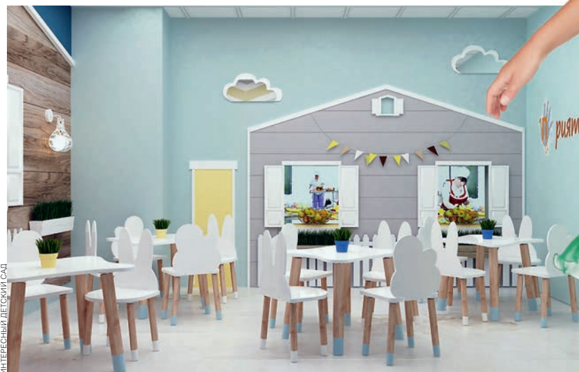
ИНТЕРЕСНЫЙ ДЕТСКИЙ САД