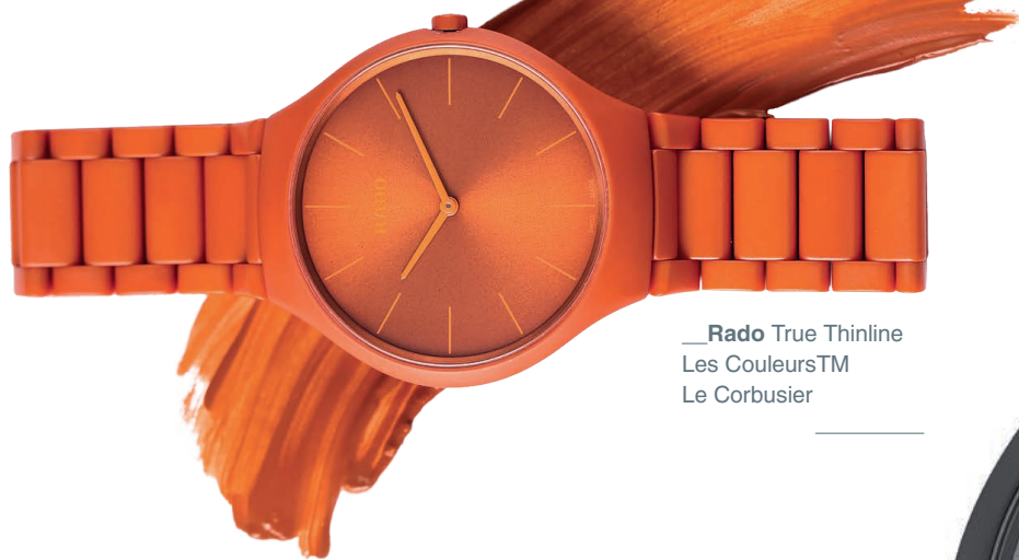
— Rado True Thinline Les Couleurs™ Le Corbusier

Компания Rado и фонд Ле Корбюзье сделали коллекцию True Thinline Les Couleurs Le Corbusier, в которую вошли девять часов в девяти цветах «архитектурной полихромии» Ле Корбюзье, одной из главных современных теорий цвета.