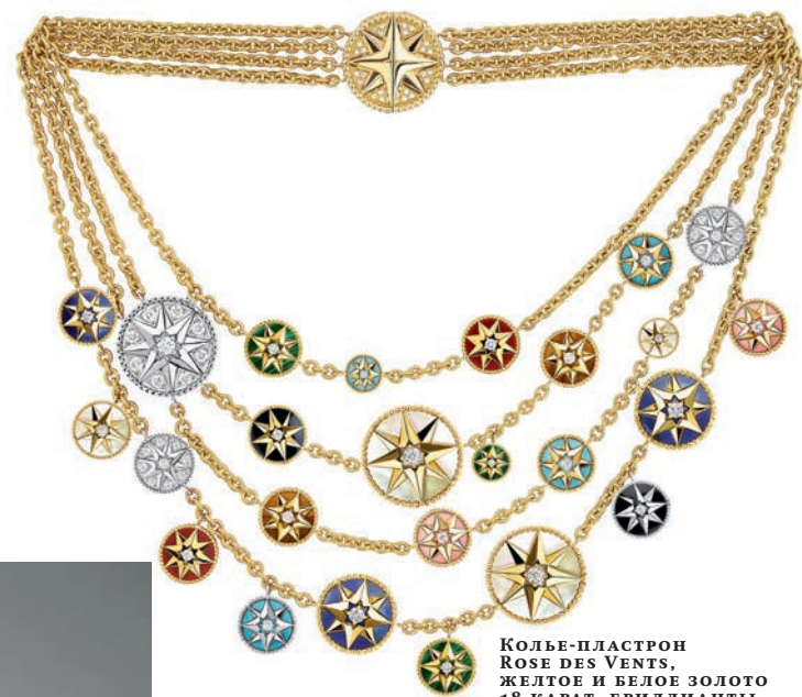
КОЛЬЕ-ПЛАСТРОН ROSE DES VENTS, ЖЕЛТОЕ И БЕЛОЕ ЗОЛОТО 18 КАРАТ, БРИЛЛИАНТЫ И ПОЛУДРАГОЦЕННЫЕ КАМНИ