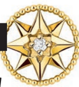
СЕРЬГА ROSE DES VENTS, ЖЕЛТОЕ ЗОЛОТО 18 КАРАТ, БРИЛЛИАНТ И ПЕРЛАМУТР