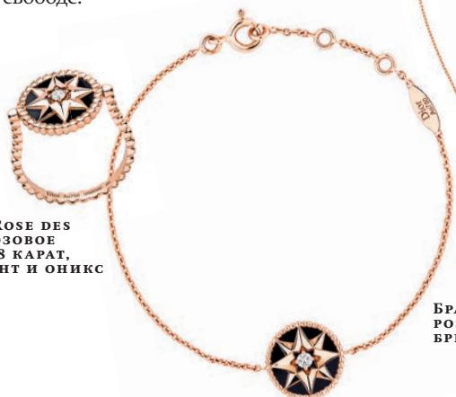
КОЛЬЦО ROSE DES VENTS, РОЗОВОЕ ЗОЛОТО 18 КАРАТ, БРИЛЛИАНТ И ОНИКС