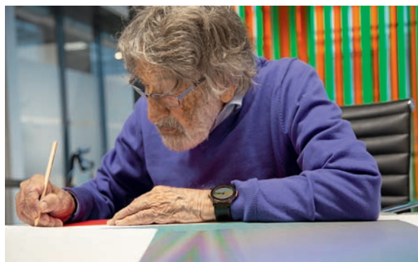
ATELIER CRUZ-DIEZ, PARIS