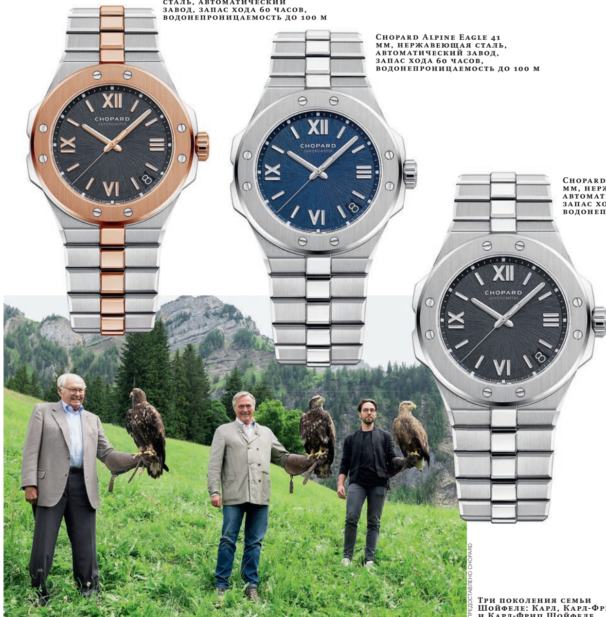
CHOPARD ALPINE EAGLE 41 ММ, НЕРЖАВЕЮЩАЯ СТАЛЬ, АВТОМАТИЧЕСКИЙ ЗАВОД, ЗАПАС ХОДА 60 ЧАСОВ, ВОДОНЕПРОНИЦАЕМОСТЬ ДО 100 М