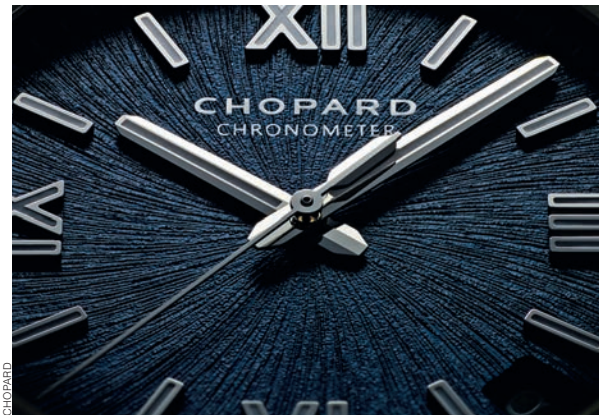
CHOPARD ALPINE EAGLE 41 ММ, РОЗОВОЕ ЗОЛОТО 750-Й ПРОБЫ И НЕРЖАВЕЮЩАЯ СТАЛЬ, АВТОМАТИЧЕСКИЙ ЗАВОД, ЗАПАС ХОДА 60 ЧАСОВ, ВОДОНЕПРОНИЦАЕМОСТЬ ДО 100 М