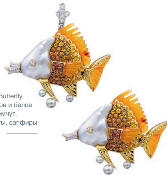
— Броши Butterfly Fish, желтое и белое золото, жемчуг, бриллианты, сапфиры