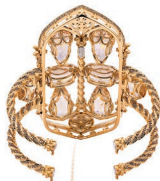
— Браслет Florence, розовое золото, коньячные бриллианты, морганиты