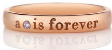
___ Кольцо Forever, розовое золото, бриллианты