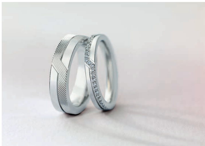
___ Кольца Promise, платина, бриллианты