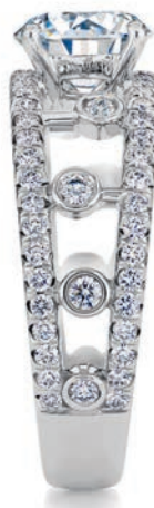
___ Кольцо Dewdrop, белое золото, бриллианты