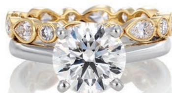
___ Кольца DB Classic, желтое и белое золото, бриллианты