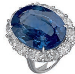
__Кольцо Color, белое золото, бриллианты, сапфир огранки «овал» весом 39 карат