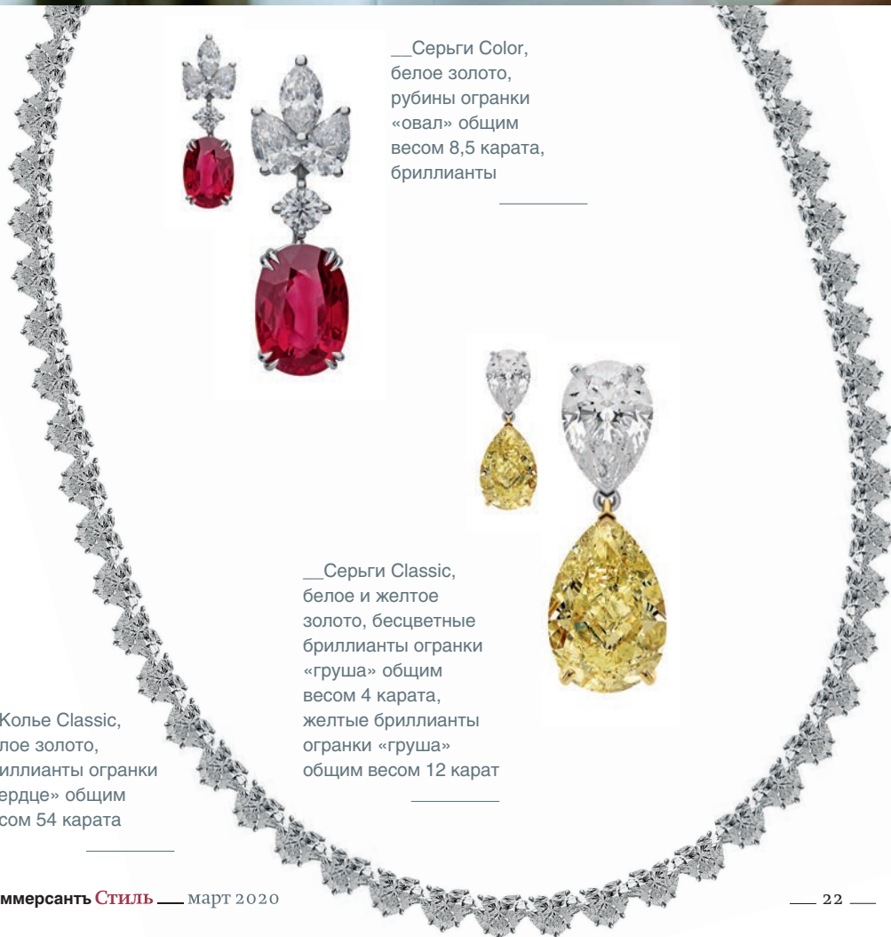
__Серьги Color, белое золото, рубины огранки «овал» общим весом 8,5 карата, бриллианты