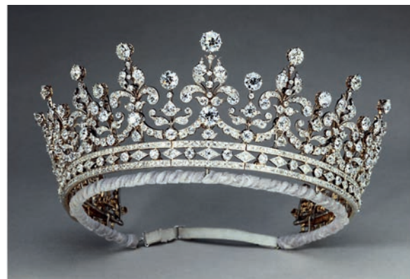
— Тиара The Girls of Great Britain and Ireland, серебро, золото, бриллианты, 1893 год