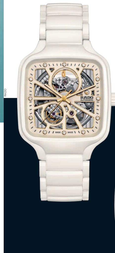
Rado True Square Automatic Open Heart в корпусе из белой керамики с механизмом ETA C07.631 с автоподза- водом и запасом хода до 80 часов