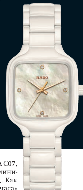
Rado True Square в корпусе из белой керамики с белым перламутро- вым циферблатом с 12 бриллиантами

В более крупных моделях Rado True Square Automatic установлены ETA C07, механические калибры с автоподзаходом и резервом хода 80 часов. В миниатюрных Rado True Square Quartz место механики занимает кварц. Как и десять лет назад, у всех моделей есть окошко даты на отметке «3 часа» заводной головки. И, как и десять лет назад, эта дата миниатюрна, что делает ее скорее украшением, чем реально полезным усложнением.