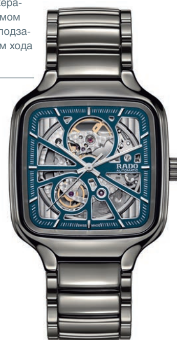
Rado True Square Automatic Open Heart в корпусе из черной полированной керамики с механизмом ETA C07.631 с автопод- заводом и запасом хода до 80 часов