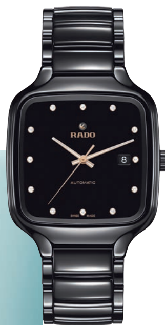
Rado True Square Automatic в корпусе из черной полированной кера- мики с механизмом ETA C07 с автоподза- водом и запасом хода до 80 часов

Сейчас часы существуют в двух размерах. Квадрат побольше — 38,0 x 44,2 мм (уже это показывает, что никакой примитивной геометрии здесь нет, — Square, конечно же, True, но только на вид), квадрат поменьше, на женскую руку, — 29,0 x 34,3 мм. Дальше можно выбирать между черным или зеленым и синим и даже перламутровым циферблатом. При этом цветной циферблат всегда используется в часах с корпусами более серого оттенка из плазменной высокотехнологичной керамики.