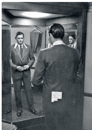
ГРЕГОРИ ПЕК НА ПРИМЕРКЕ КОСТЮМА ДЛЯ СЪЕМОК В ФИЛЬМЕ «ЧЕЛОВЕК В СЕРОМ ФЛАНЕЛЕВОМ КОСТЮМЕ», 1955 ГОД

Костюмы Henderson, впрочем, не ароматизируют, но обрабатывают составами, отталкивающими грязь и воду. В коллекции Henderson есть фланелевые костюмы разного покроя — приталенные, свободные — все сшиты по технологии Half Canvas. В мужской моде это синоним демикююра, то есть технология, объединяющая ручной и машинный пошив. Любую модель можно с помощью портных бренда быстро скорректировать с учетом особенностей фигуры — бесплатно подшить брюки, укоротить рукава.