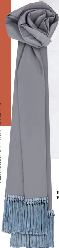
БРОШЬ-БАНК ИЗ ТАФТЫ И МУАРА С БАХРОЙ