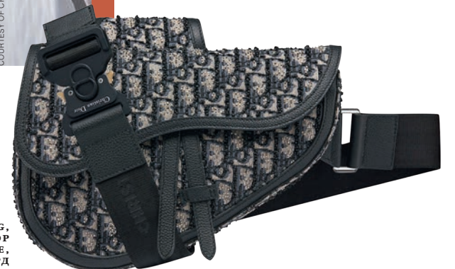
DIOR SADDLE BAG, ВЫШИТЫЙ УЗОР DIOR OBLIQUE, ЖАККАРД