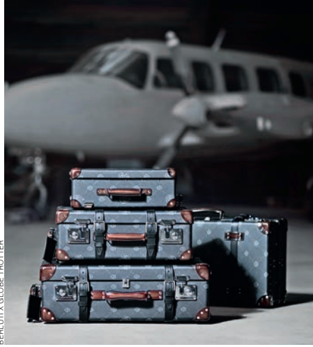
BERLUTI X GLOBE TROTTER

Марка Maserati представляет новый гоночный автомобиль MC20 — то есть Maserati Corse 2020. Новинка получила карбоновый монокок и двухрычажные подвески с регулируемыми амортизаторами. Одно и то же шасси (с незначительными изменениями) будет использоваться в трех модификациях: бензиновых купе и родстере, а также электромобиле. У первых двух внутри будет трехлитровый V6 Nettuno на 630 л. с., впервые за 20 лет полностью созданный на заводе в Модене и запатентованный Maserati. В соответствии с традиционной гоночной компоновкой он расположен сзади.