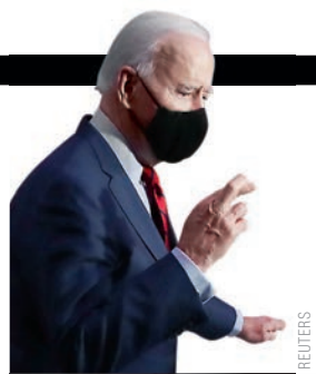
ПРЕЗИДЕНТ США ДЖО БАЙДЕН (В ИНТЕРВЬЮ ABC)

«УГУ. Я СОГЛАСЕН» – В ОТВЕТ НА ВОПРОС ВЕДУЩЕГО «ВЫ ДУМАЕТЕ, ЧТО ОН (ПУТИН. – „ДЕНЬГИ“) УБИЙЦА?».